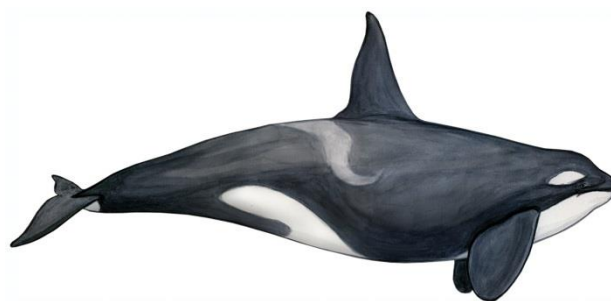
Figure 1. Épaulard

La répartition des épaulards dans l'Atlantique Nord-Ouest et l'est de l'Arctique n'est pas bien documentée. Les épaulards étaient jadis communs dans le golfe et l'estuaire du Saint-Laurent, mais on les observe désormais le plus souvent dans les eaux côtières de Terre-Neuve, en particulier dans le détroit de Belle Isle. Les épaulards ont été plus fréquemment observés dans l'est de l'Arctique au cours des dernières décennies, en particulier dans la baie d'Hudson, tandis qu'on ne les observe que rarement dans l'ouest de l'Arctique. Les déplacements des épaulards ne semblent pas être limités par les caractéristiques de leur environnement, à l'exception de l'éventuelle présence de glace de mer sous les hautes latitudes. Dans l'Arctique, le recul de la glace de mer semble donner aux épaulards accès à davantage d'habitat (et de proies).